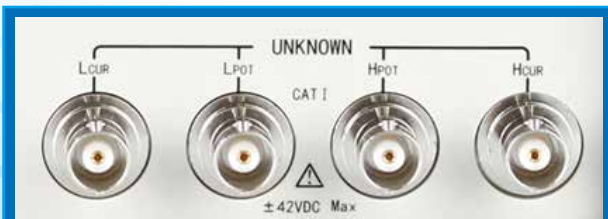
Four terminal measurement